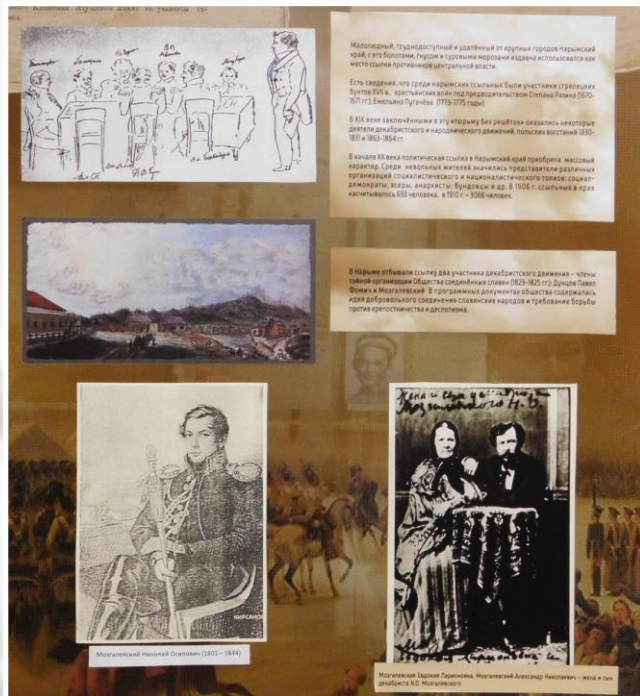
Из экспозиции Нарымского музея политической ссылки