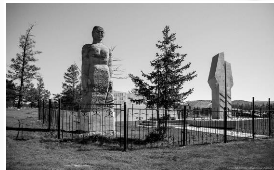
Мемориал погибшим воинам в селе Тоора- Хеме Тоджинского кожууна