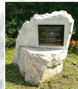
Памятный знак на месте захоронения Н.О. Мозгалевского в г. Минусинске